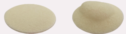
Nursicare® relativamente seco - no es necesario cambiarlo